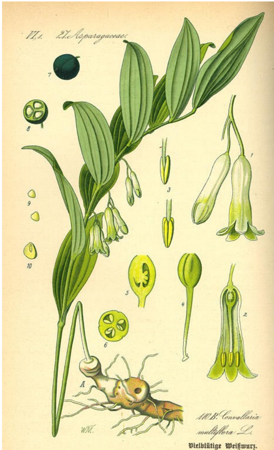
Polygonatum multiflorum . Làmina: THOMÈ, OTTO WILHELM